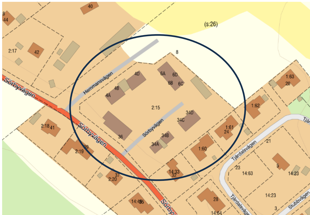
Kartbild över området som markanvisningen gäller

Överlåtelse kan ske genom försäljning eller upplåtelse med tomträtt. Priset baserar sig på ett marknadspris i området och fastställs vid tid för överlåtelsen. Val av upplåtelseform fastställs i kommande avtal.