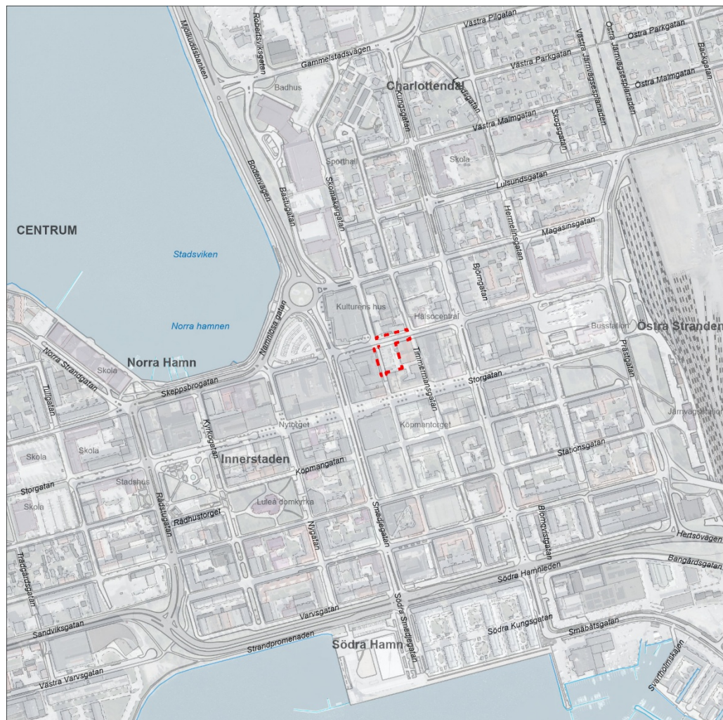
Figur 1: Översiktskarta där fastigheten Katten 6 är markerat i rött

Kommunstyrelsens arbetsutskott beslutade 2021-04-26, § 74 att ge stadsbyggnadsnämnden i uppdrag att upprätta förslag till ny detaljplan och tillhörande gestaltungsprogram för del av Katten 6, i syfte att pröva förutsättningarna för bostäder och verksamheter.