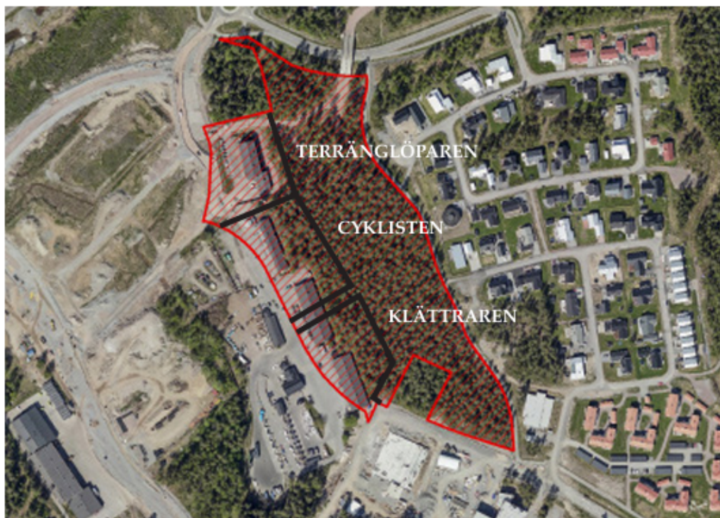
Figur 2: Kommande kvartersnamn och kvarterstruktur markerat med svarta linjer

Planförslaget innebär att kulturvärden inom Kv. Terränglöparen fortsatt skyddas, användningen regleras till centrumverksamhet, att byggrätten utökas samt att gården kan förses med mindre komplementbyggnader.